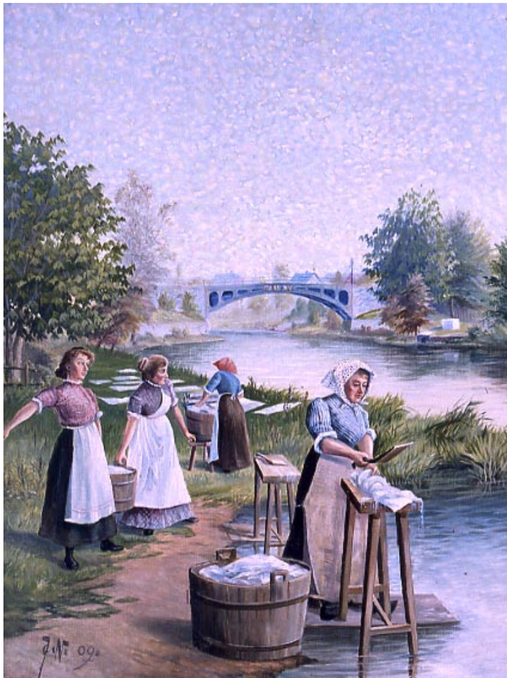
Signaturen JN målade denna bild år 1909, med motivet fyra damer som nedströms Carl XV:s bro arbetar med sin byk, långt före de kommunala tvättstugornas tid.