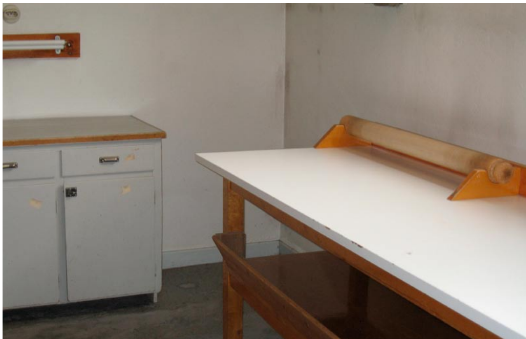
Arbetsbänken med den extra mangelrulle som används till att ta av eller placera in nya lakan. Bilder från tvättstugan 2008: Marléne Johansson.

nen manglades kortare tid. Örngottens knytband fick jag sedan krusa hemma med en krulltång (med hjälp av en bordskniv kunde också gå bra).