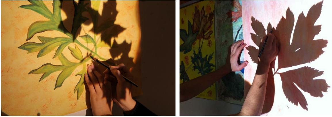
Bild 3 och 4: Eleverna arbetar med bilduppgifter i flera steg. Genom arbetet med att projicera skuggor av växter på papper på väggen kan bilder skapas genom att arbeta med teckningar och målning i flera lager. Sedan kan teckningarna utvecklas vidare genom sammanställning av mönster och ornament i individuella eller gruppvisa arrangemang.