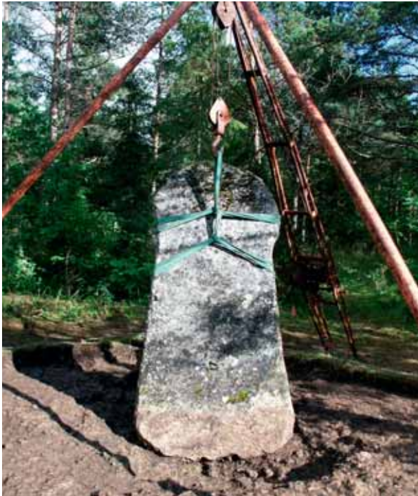
Bildstenen vid FRÖJEL STENSTUGU är frilagd. Observera hur litet av stenens fot som låg under mark.

Idag går gränsen mellan Klinte och Fröjel socken inte långt ifrån bildstenen. Dess placering medger antagandet att den senare sockengränsen återspeglar en äldre bygdegräns mellan områdena då bildstenen uppfördes. Fröjel socken kan delas upp i tre bygder; Övre Fröjel i inlandet, Nedre Fröjel vid kusten kring Fröjel kyrka och Mulde i norr. Dessa tre utgjorde förmodligen egna förhistoriska bygdeenheter före den medeltida sockenindelningen. Närområdet kring bildstenen utgörs idag av gårdarna Stenstugu, Robbjäns, Mølner, Hägur, Mulde, Prästgården och Däpps. Dessa utgör tillsammans en mycket intressant fornlämningsbygd, idag med samlingsnamnet Mulde, och uppvisar bland annat fornborg, husgrunder, fossila åkersystem och gravhögar.