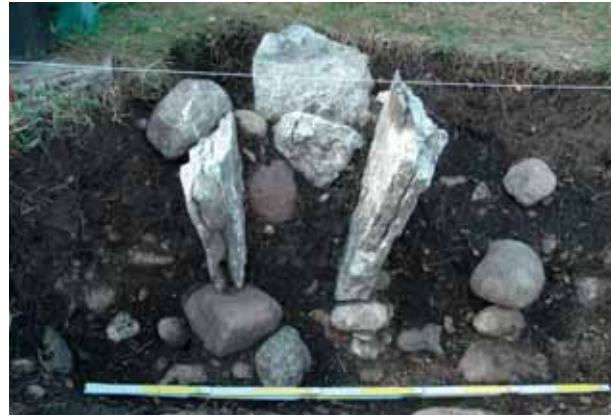
Stolphål 2 var stensatt med tre kalkstensskivor som visade sig vara delar av bildstenar.