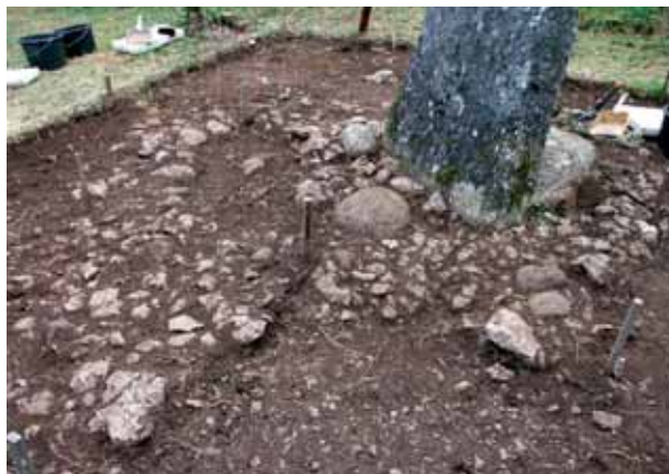
Foto Arkeologisk undersökning vid FRÖJEL STENSTUGU, 2007.

Nederst: Bildstenen var stöttad med två stora stenar framför och en större bakom samt med jord och stenfyllning. Uppenbarligen har det inte räckt för att i längden hålla bildstenen helt upprätt.