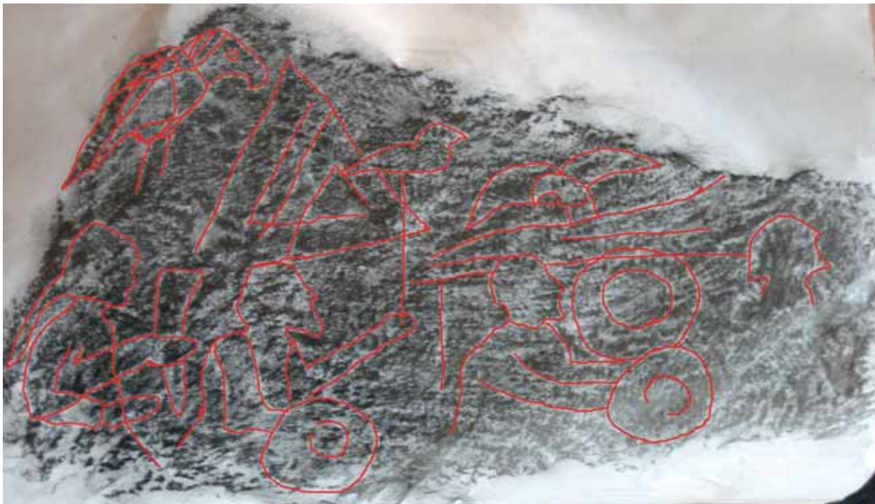
Frottage utav en av kalkstenarna som påträffades i stolphålen vid BUTTLE ÄNGE. På stenen kan ses en kvinna med dryckeshorn, tre män och sköldar, en triskel samt tre fågelfigurer.