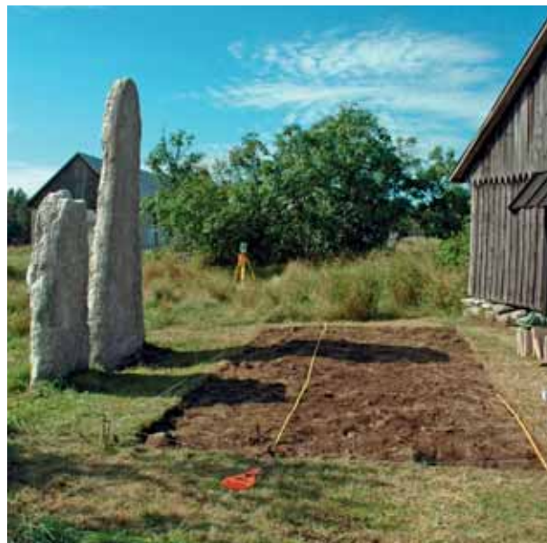
Utgrävningsschaktet vid BUTTLE ÄNGE låg mellan de kvarstående två bildstenarna till vänster och den gamla smedjan till höger.

Under utgrävningen år 1911 påträffade Nordin i fundamentet bakom de två bildstenarna fem mindre bildstenar, 47 varav en gick förlorad under transporten till Visby. 48