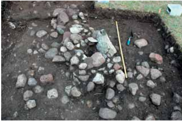
Stolphål 1 var centralt placerad i husets grundmur. Stensatt med en kalkstensskiva och gråsten. Foto Arkeologisk undersökning vid BUTTLE ÄNGE, 2009.