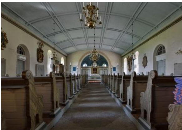
Fig. 8 Medelplana kyrka, långhuset mot koret i norr

Medelplana medeltidskyrka anses vara uppförd under 1100-talet och liksom Västerplana var kyrkan i enlighet med den gamla kristna traditionen orienterad i öst-västlig riktning med koret mot öster. Medelplana hade i likhet med Västerplana ett långhus med ett smalare rakt avslutat kor med en anslutande sakristia på norrsidan och ett vapenhus vid ingångsporten i söder. Den medeltida kyrkan var ungefär lika stor som Västerplana, men eftersom murrester av medeltidskyrkan endast finns kvar i västra murverket mot tornet är det omöjligt att göra sig en bild av hur den såg ut.