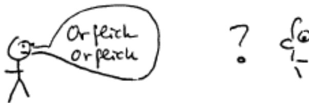
Om behovet av grammatik

I alla språk finns en grammatik som anger en sorts ordningsregler för hur ord och morfem får användas tillsammans. Om vi vill uttrycka en viss betydelse kräver detta för det första att de morfem vi valt motsvarar vad vi vill uttrycka, för det andra att morfemen kommer i rätt ordning och för det tredje att inga relevanta morfem utelämnas och inga irrelevanta morfem inkluderas. Jag satt bilen och Jag hade satt i bilen är inte grammatiskt lyckade uttryck för att säga Jag satt i bilen . Med hjälp av grammatiken blir det möjligt för oss att få en relativt exakt innebörd även i komplexa betydelsesammanhang, något som sedan kan utnyttjas för att överföra och lagra komplexa typer av information.